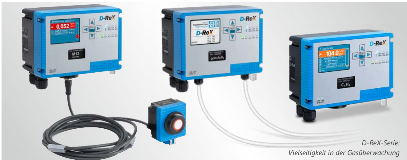
D-ReX-Serie: Vielseitigkeit in der Gasüberwachung

Für die Detektion von mehr als 60 verschiedenen Gasen stehen Ihnen elektrochemische, Wärmetönungs-, Infrarot- und PID-Sensoren zur Auswahl.