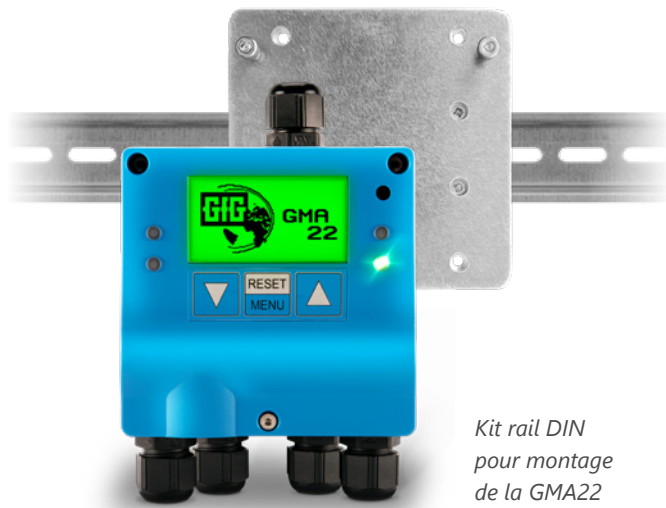
Kit rail DIN pour montage de la GMA22

L'option d'adresser non seulement les transmetteurs, mais aussi jusqu'à 4 modules relais supplémentaires de type GMA200-RT ou GMA200-RTD via l'interface numérique RS485 offre encore plus de flexibilité.