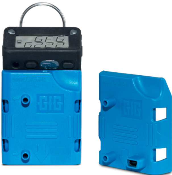
Micro 5 mit Kalibrierkappe. Alternativ ist die smarte Kalibrierkappe mit Infrarotschnittstelle und Mini-USB-Buchse erhältlich.

Wollen Sie außerdem den Datenlogger auslesen, brauchen Sie stattdessen die smarte Kalibrierkappe, ein USB-Kabel und die Config-Software für die G222-Serie.