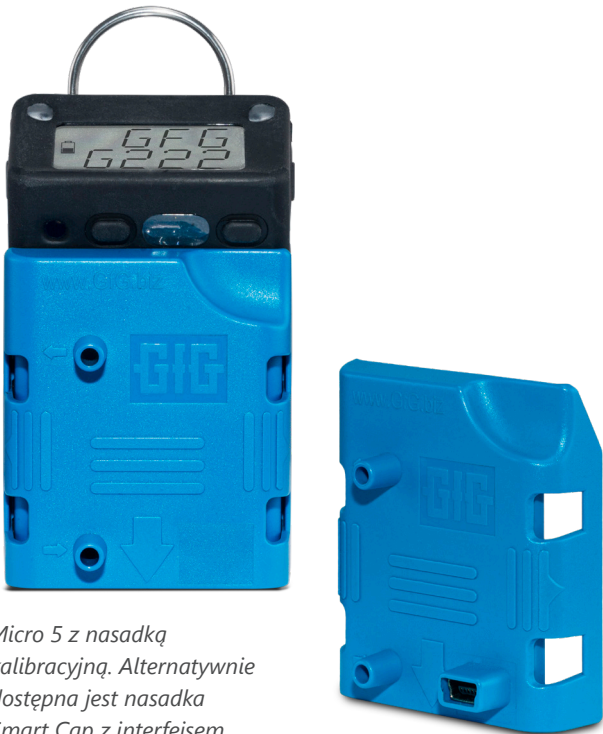
Micro 5 z nasadką kalibracyjną. Alternatywnie dostępna jest nasadka Smart Cap z interfejsem podczerwieni i wtyczką mini-USB.

Do odczytu zawartości rejestratora danych potrzebna jest nasadka Smart Cap, kabel połączeniowy USB oraz oprogramowanie konfiguracyjne dla serii G222.